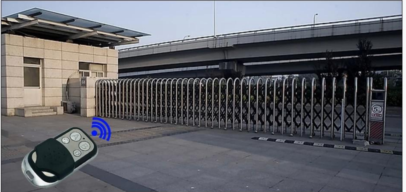
Electric telescopic door