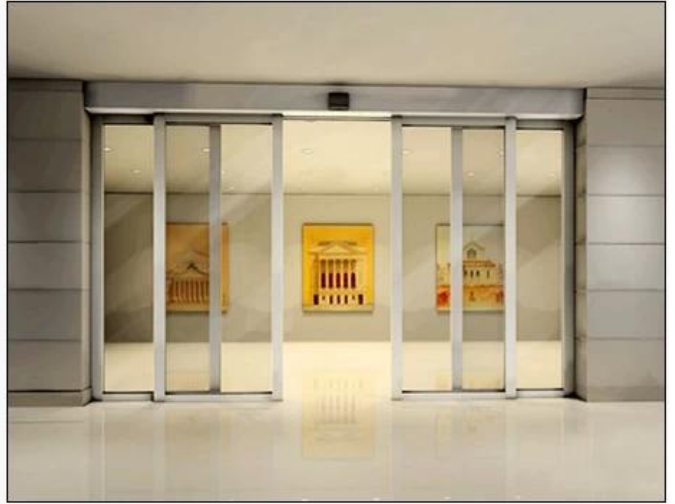
Induction auto doors