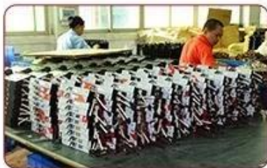
▲ Workshop Assembly