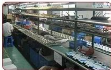
▲ Workshop Assembly