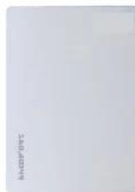
Master Delete Card