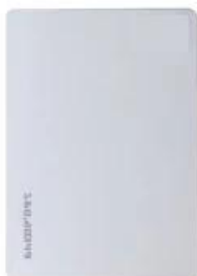
Master Add Card