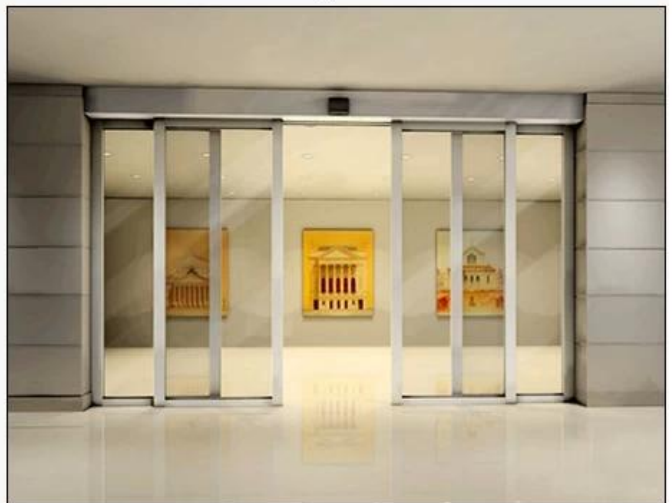
Induction auto doors