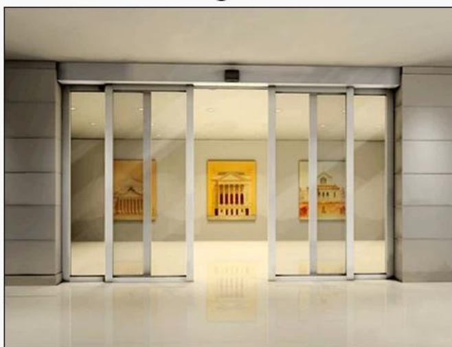
Induction auto doors