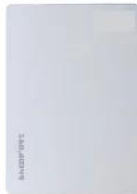
Master Delete Card