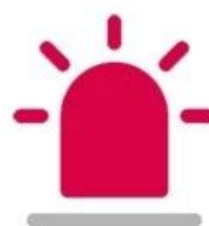
Intelligent Alarm Status