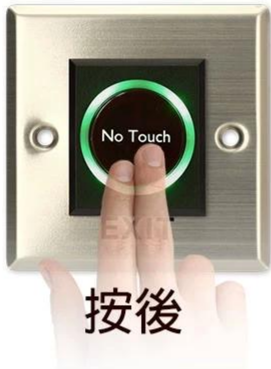
Green LED Indicator: Power ON (Triggered)