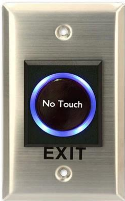
Blue LED Indicator: Power ON (Standby)