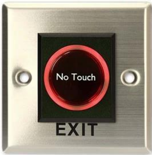
Red LED Indicator: Power ON (Standby)